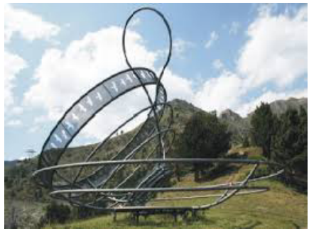
Dennis Oppenheim. "Tempestat en una tassa de té". La Massana