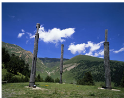
Jorge Du Bon. "Estructures autogeneradores". Espirall que es desenvolupa dins de si mateixa. Canillo

problemes de relació amb les institucions, els proveïdors i realitzadors de les obres.