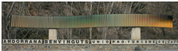
Carlos Cruz-Díez. "Fisicromia per Andorra". Sant Julià de Lòria

l'edifici de Prada Casadet, va escollir la volta accidental de l'edifici i va crear un robot en suspensió amb elements de bronze recuperats d'un vaixell desarmat, construït els anys 30 i de nacionalitat txecoslovaca. Al final va